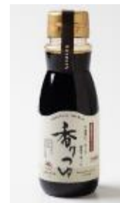
図 1. 「香りつゆ」 (彩まる合同会社)

このような分析を通して、彩まる合同会社への商品開発支援を実施し、開発目標であった食品添加物を使用せずに市販のだしつゆ商品と同等以上のうま味強度を持った新商品「香りつゆ」が 2020 年 9 月に同社より発売となった（図 1）。