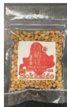
図4. 「ドライ納豆」 (株式会社中田園)