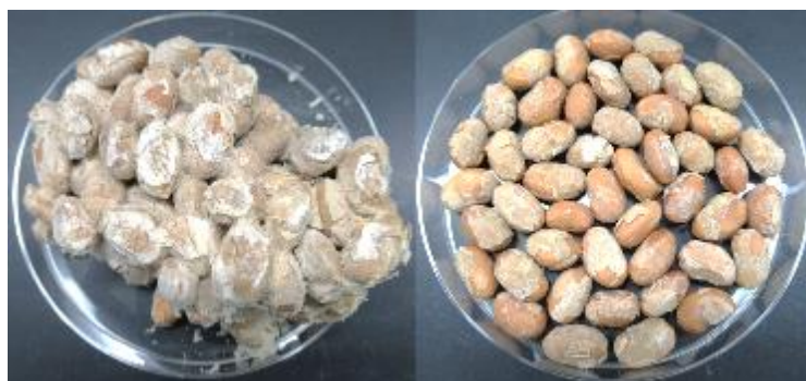
図3. フリーズドライ納豆の糸の除去 左：糸の除去前 右：糸の除去後